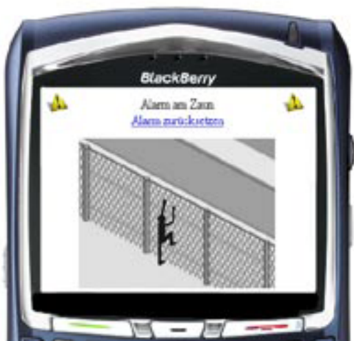
Direkte Alarmierung eines Endgerätes: das Sicherheitspersonal entscheidet über die weitere Vorgehensweise

Netzlink arbeitet mit führenden Partnern aus unterschiedlichen Fachgebieten zusammen. Die Vorteile der BlackBerry Enterprise Solution werden effektiv mit der innovativen Zauntechnik der Haverkamp GmbH und der intelligenten Kamertechnologie der Geutebrück GmbH verknüpft. Durch die Integration von Sicherheitstechnik mit mobilen Endgeräten eröffnen sich vielfältige Möglichkeiten, bestehende Sicherheitskonzepte sinnvoll zu ergänzen. Durch den modularen Aufbau der verwendeten Komponenten können wir eine an Ihre Bedürfnisse angepasste Lösung erstellen.